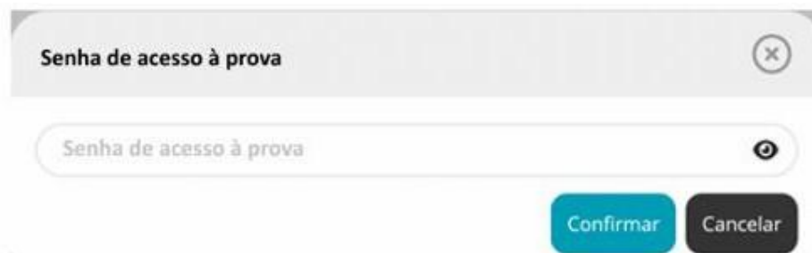
Figura 3 - senha de acesso à prova

11.13. Depois de aceder à prova é solicitada a senha de acesso à prova. Inserindo a senha de acesso e pressionando o botão “Confirmar” a prova é iniciada.