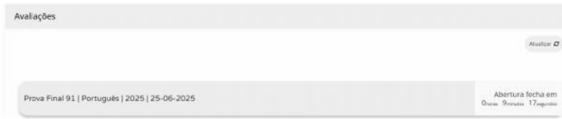
Figura 2 – Acesso à prova a realizar

11.12. Para aceder à prova, o aluno tem de clicar em cima da zona cinzenta onde se encontra escrito o nome da prova.