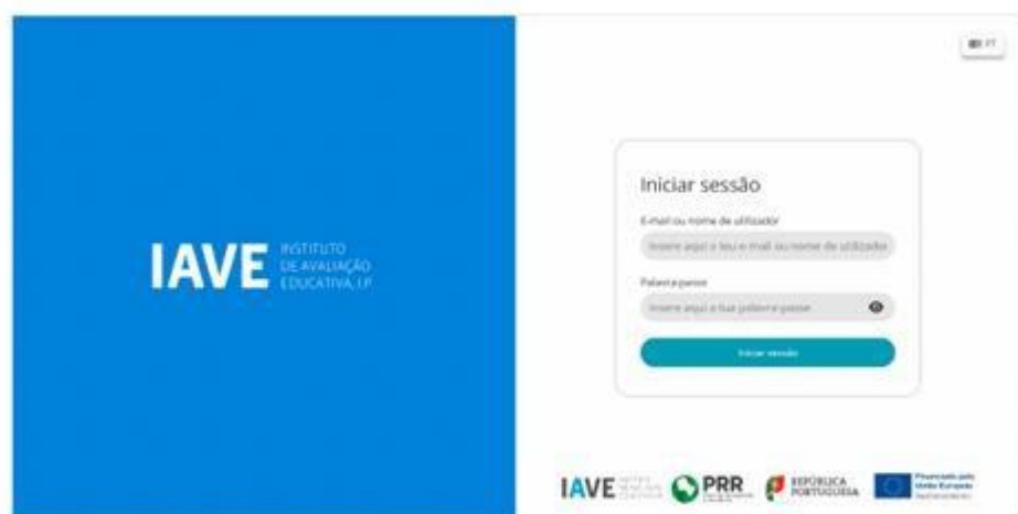
Figura 1 – Acesso à Plataforma de Realização de Provas do IAVE

b) Apenas para o online, selecionar o endereço eletrónico https://provas.iave.pt . (Obs.: Para as escolas que optaram pelo offline em rede ou standalone, os procedimentos para acederem à Plataforma de Realização de Provas do EduQA são os constantes no Manual Offline, publicado na Área Escolas do JNE);