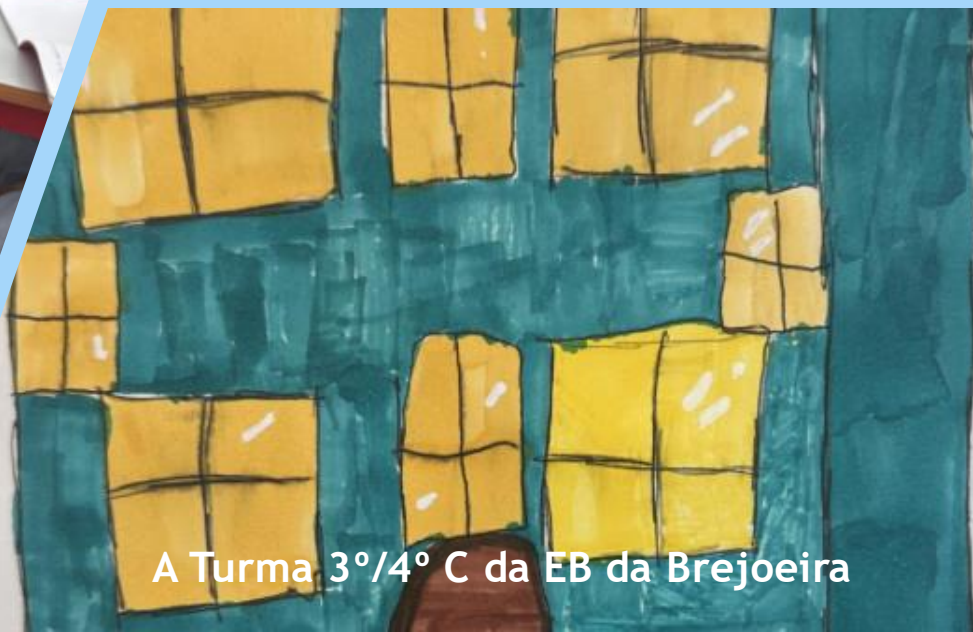
A Turma 3º/4º C da EB da Brejoeira