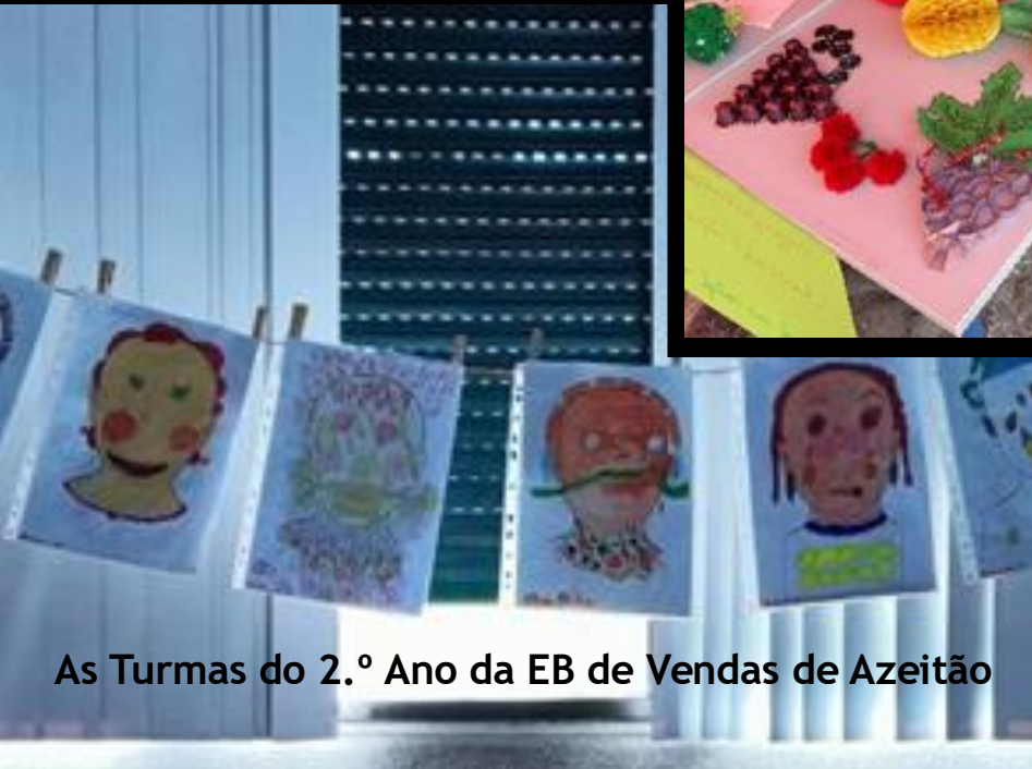
As Turmas do 2.º Ano da EB de Vendas de Azeitão